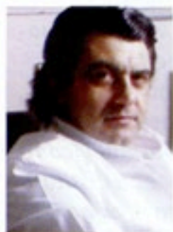
Prof. Marco Gasparotti chirurgo plastico Roma

Il protocollo prevede un periodo di 8-10 giorni di alimentazione proteica attraverso un sottilissimo sondino nasogastrico che garantisce una perdita dall'8 al 10% del peso corporeo, esclusivamente dalla massa grassa. Dopo la rimozione del sondino il paziente viene seguito per altre due settimane in cui seguirà una dieta bilanciata e gli viene insegnato a mangiare sano, per una ulteriore perdita di peso fino al 4% e il mantenimento